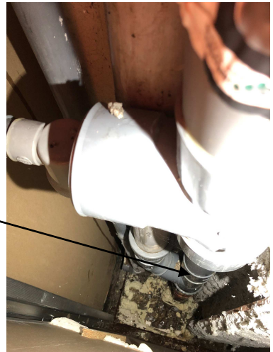
Fuite au niveau de la jonction de deux canalisations dans le coffrage