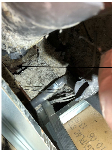
Fuite au niveau de la naissance d'eau pluviale