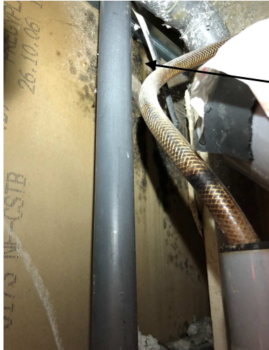
Fuite au niveau des relevés